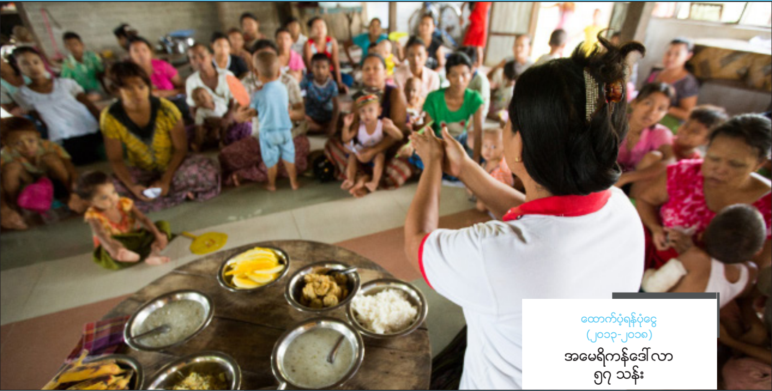
ထောက်ပံ့ရန်ပုံငွေ (၂၀၁၃-၂၀၁၈) အမေရိကန်ဒေါ်လာ ၅၇ သန်း

အသက်မွေးဝမ်းကျောင်းမှုနှင့် စားနပ်ရိက္ခာဖူလုံရေး ရန်ပုံငွေ (LIFT) စီမံကိန်း ၂၀၁၃ - ၂၀၁၈