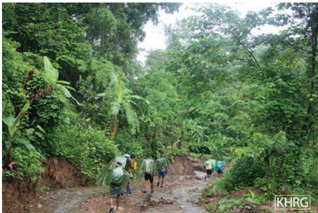
ဤပုံတို့အား ၂၀၁၇ ခုနှစ်၊ ဇွန်လ ၁၅ ရက်နေ့တွင် မူကြော်(ဖာပွန်)ခရိုင်၊ ဘူးသိုမြို့နယ်၊ အီးတူထာ IDP စခန်းနှင့် IDP စခန်း၏ အပြင်ဖက်ရှိ လမ်းကြားတစ်ခုတွင် ရိုက်ယူခဲ့ပါသည်။ ဤပုံသည် ခလယ်လွှီထူ (ညောင်လေးပင်)ခရိုင်၊ မူး (မုန်း)မြို့နယ်ရှိ မရမ်းပင် ပြန်လည်နေရာချထားရေး နေရာသို့ မိမိအစီအစဉ်ဖြင့်ပြန်သွားခဲ့ကြသော IDP မိသားစုများ၏ပုံဖြစ်ပါသည်။