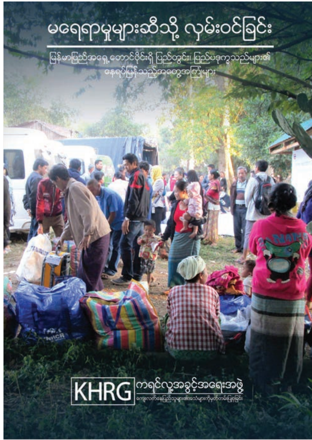
အစီရင်ခံစာအပြည့်အစုံကို အင်္ဂလိပ်ဘာသာ၊ မြန်မာဘာသာများဖြင့် ရရှိနိုင်ပါသည်။ အစီရင်ခံစာအားလုံးကို www.khrgh.org တွင် ရယူနိုင်ပါသည်။

KHRG မှဘားအံခရိုင်၊ မယ်လဝေလယ်မူးနှင့် ဒူးပလာယာခရိုင်၊ လေးဖာထောသို့ လတ်တလောပြန်လည် အခြေချနေထိုင်သည့်ဒုက္ခသည်များ၏ အခြေအနေနှင့် ပတ်သက်သည့် သတင်းအကျဉ်းချုပ်တစ်ခုကို ၂၀၁၉ ခုနှစ်၊ ဇွန်လတွင် ထုတ်ပြန်ခဲ့သည်။ အဆိုပါသတင်းအကျဉ်းချုပ်၏ ဖော်ပြချက်အရ ၂၀၁၉ ခုနှစ်၊ ဖေဖော်ဝါရီလတွင် နေရပ်ပြန်သူအများစုမှာ UNHCR နှင့် အခြားလုပ်ဖော်ကိုင်ဖက်အဖွဲ့အစည်းများ၏အကူအညီဖြင့် ထိုင်းအစိုးရနှင့်မြန်မာအစိုးရတို့မှဦးဆောင်သော မိမိဆန္ဒအလျောက် ပြန်လည်နေရာချထားရေးအစီအစဉ်ဖြင့် မြန်မာပြည်တွင်းသို့ပြန်လာခဲ့သူများဖြစ်ကြသည်။ ၂၀၁၉ ခုနှစ်၊ ဖေဖော်ဝါရီလတွင်ပြုလုပ်ခဲ့သည့် UNHCR အကူအညီဖြင့်နေရာပြန်လည်ချထားမှုသည် တတိယအကြိမ်ပြုလုပ်ခဲ့ခြင်းဖြစ်ပြီး ဤအစီအစဉ်အား နောင်တွင်လည်း ဆက်လက်လုပ်ဆောင်သွားရန်ရှိပါသည်။