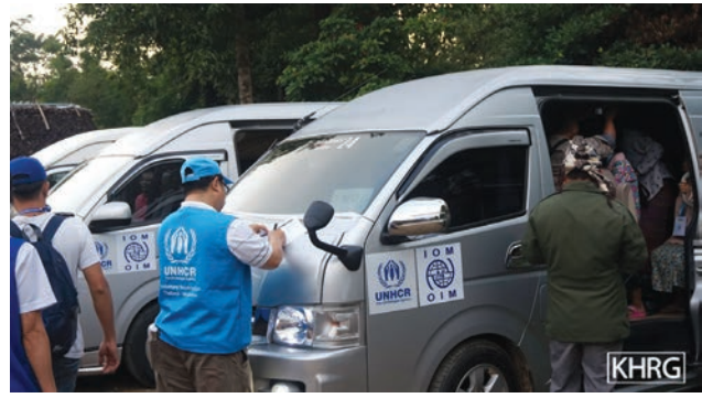
ဤပုံများအား ၂၀၁၈ ခုနှစ်၊ မေလ ၈ ရက်နေ့တွင် နို့ဖိုးယာယီဒုက္ခသည်စခန်းတွင်ရိုက်ယူခဲ့ပါသည်။ ထိုင်း-မြန်မာအစိုးရနှင့် UNHCR တို့မှဦးစီးဆောင်ရွက်ပြီး ဒုတိယအကြိမ်အဖြစ် ပြန်လည်နေရာချထားခြင်းဖြစ်ပါသည်။ ဤအကြိမ်တွင် စုစုပေါင်း ဒုက္ခသည် ၉၃ ဦးပြန်လာခဲ့ကြပါသည်။