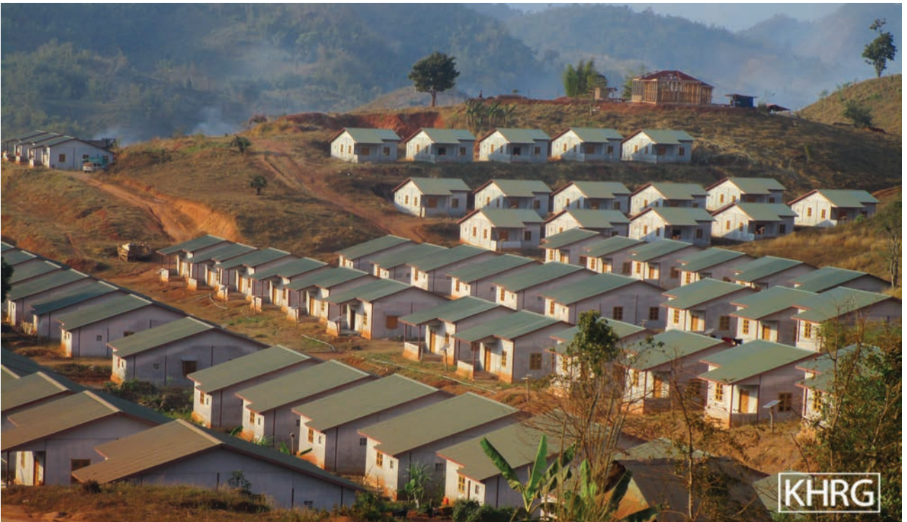
ဤပုံအား ၂၀၂၀ ခုနှစ်၊ ဖေဖော်ဝါရီလ ၆ ရက်နေ့တွင် ဒူးပလာယာခရိုင်၊ ကော်တရီ (ကော့ကရိတ်) မြို့နယ်၊ ကော်လားကျေးရွာကို ရိုက်ယူခဲ့သည့် ဗီဒီယိုထဲမှ ပုံကိုပြန်လည်ယူထားခြင်းဖြစ်ပါသည်။ ကော်လားကျေးရွာသည် နေရပ်ပြန်သူများအတွက် ချမှတ်ထားသည့် ပြန်လည်နေရာချထားရေး နေရာထဲတွင် တစ်ခုအပါအဝင်ဖြစ်ပါသည်။ ဤပုံသည် ဒုက္ခသည်များနှင့် IDP နေရပ်ပြန်သူများအတွက် အသစ်ဆောက်လုပ်ထားသော အိမ်အလုံး သုံးရာ၏ပုံ ဖြစ်ပါသည်။