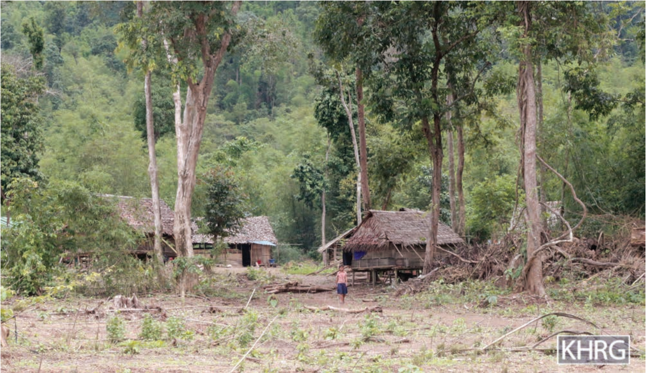
ဤပုံအား ၂၀၁၇ ခုနှစ်၊ ဇွန်လ ၂၄ ရက်နေ့တွင် ခလယ်လွီထူ (ညောင်လေးပင်) ခရိုင်၊ မူး (မုန်း) မြို့နယ်၊ မရမ်းပင်ကျေးရွာတွင် ရိုက်ယူခဲ့ပါသည်။ ဤပုံသည် မရမ်းပင်ကျေးရွာသို့ ပြန်လည်နေထိုင်ကြသော IDP များ၏အိမ်များပုံဖြစ်ပါသည်။