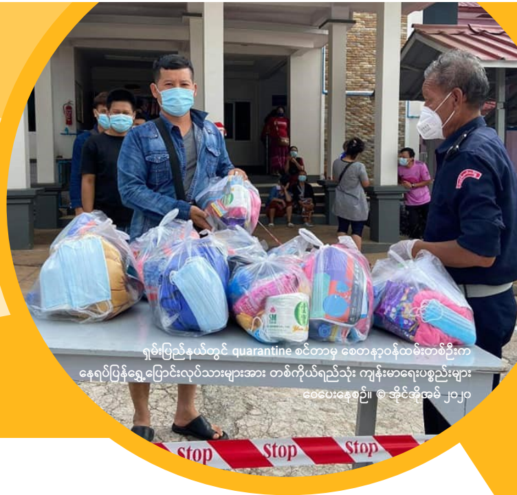
ရှမ်းပြည်နယ်တွင် quarantine စင်တာမှ စေတနာ့ဝန်ထမ်းတစ်ဦးက နေရပ်ပြန်ရွှေ့ပြောင်းလုပ်သားများအား တစ်ကိုယ်ရည်သုံး ကျန်းမာရေးပစ္စည်းများ ဝေပေးနေစဉ်။