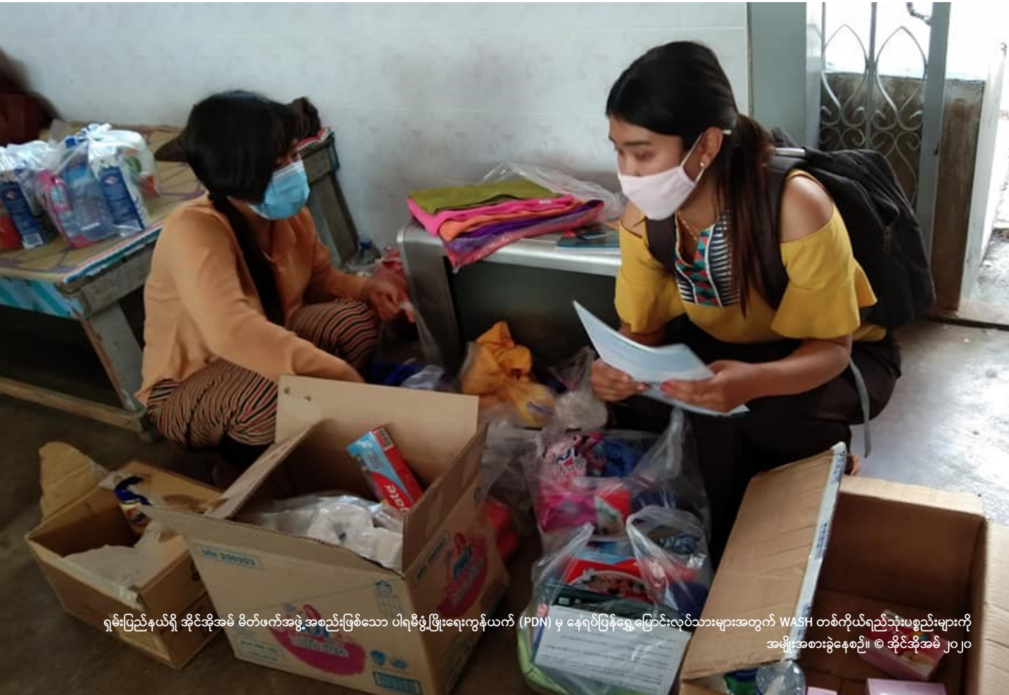
ရှမ်းပြည်နယ်ရှိ အိုင်အိုအမ် မိတ်ဖက်အဖွဲ့အစည်းဖြစ်သော ပါရမီဖွံ့ဖြိုးရေးကွန်ယက် (PDN) မှ နေရပ်ပြန်ရွှေ့ပြောင်းလုပ်သားများအတွက် WASH တစ်ကိုယ်ရည်သုံးပစ္စည်းများကို အမျိုးအစားခွဲနေစဉ်။

၏ ရာခိုင်နှုန်းဖြစ်သော ၉၀ ရာခိုင်နှုန်းကိုလည်း စီးပွားရေးခက်ခဲမှု တစ်ခုအဖြစ် သက်ရောက်လာပါလိမ့် မည်။ အမျိုးသားနှင့်အမျိုးသမီး (၅၀ ရာခိုင်နှုန်းထက် အနည်းငယ် နည်းသော) မှ ၎င်းတို့ အမြန်ဆုံး ပြန်လည် ရွှေ့ပြောင်းရန်စီစဉ်ထား ကြောင်းဖြေကြားခဲ့ပြီး၊ အများစုမှာ ယခင်အလုပ် လုပ်ကိုင်ခဲ့သော နေရာကိုသာ ပြန်လည်သွားရောက်ရန် စီစဉ်မည် ဟုဖြေကြားခဲ့သည်။ ပြန်လည်ရွှေ့ပြောင်းရန် အစီစဉ်မရှိသူ များထဲတွင် အများစုမှာ စိုက်ပျိုးရေးကဏ္ဍတွင် လုပ်ကိုင်ရန် ဆန္ဒရှိကြသည်။ ယခုအခြေအနေ တွင် သုံးပုံ တစ်ပုံ နီးပါးဖြစ်သော နေရပ်ပြန် များမှ အစားအစာ အထောက်အပံ့ လိုအပ်သည်ဟုဖြေဆိုခဲ့ပြီး၊ အခြား ၂၅ ရာခိုင်နှုန်းကမူ အသက်မွေးဝမ်းကျောင်းဆိုင်ရာ အကူအညီများ တောင်းဆိုထားပါ သည်။