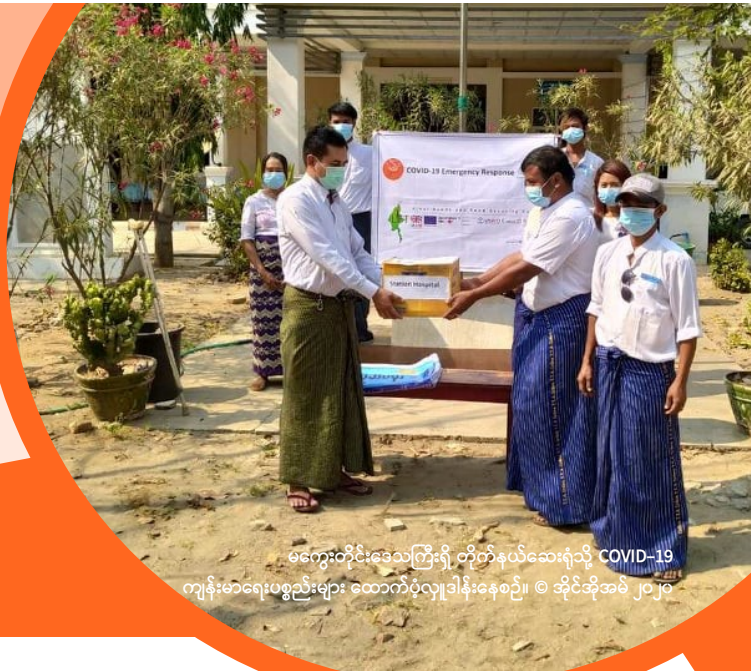
မကွေးတိုင်းဒေသကြီးရှိ တိုက်နယ်ဆေးရုံသို့ COVID-19 ကျန်းမာရေးပစ္စည်းများ ထောက်ပံ့လှူဒါန်းနေစဉ်။