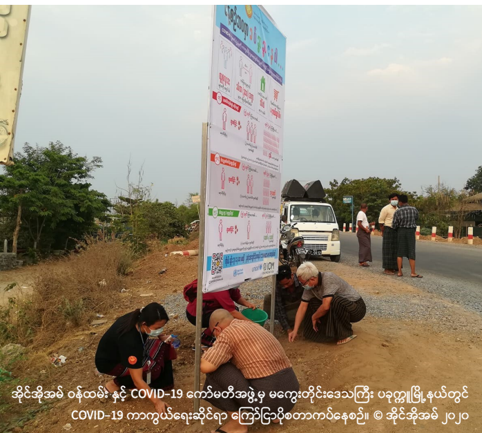
အိုင်အိုအမ် ဝန်ထမ်းနှင့် COVID-19 ကော်မတီအဖွဲ့မှ မကွေးတိုင်းဒေသကြီး ပခုက္ကူမြို့နယ်တွင် COVID-19 ကာကွယ်ရေးဆိုင်ရာ ကြော်ငြာပို့စတာကပ်နေစဉ်။

အပူပိုင်းဒေသသို့ ပြန်လာသော နေရပ်ပြန်များမှလည်း မိမိတို့နေရပ် ပြန်လာပြီးနောက် တွေ့ကြုံရသော တူညီသောစိန်ခေါ်မှုများကို ထုတ် ဖော်ဖြေဆိုကြသည်။ (ဇယား ၁ - ကိုကြည့်ရန်။) ဖြေဆိုသူများ၏ ၅၁% မှာ စစ်တမ်းတွင် ဖော်ပြထားသော အတွေ့အကြုံများ ကြုံ တွေ့ရခြင်းမရှိဟု ဖြေဆိုပြီး၊ လေးပုံတစ်ပုံသော ဖြေဆိုသူများ ၂၇% (အမျိုးသမီး ၂၆%၊ အမျိုးသား ၂၉%) သည် စိတ်ပိုင်းဆိုင်ရာ ဖိစီးမှုများ မြင့်တက်လာသည်ဟု ဖြေကာ၊ ဖြေဆိုသူ ၁၂% (အမျိုးသမီး ၁၅%၊